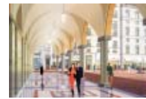
ヴィータイタリア Vita Italia

汐留住友ビル Shiodome Sumitomo Bldg. ホテル ヴィラ フォンテーヌ 汐留 Hotel Villa Fontaine SHIODOME