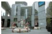
カレッタ汐留 Caretta Shiodome

This commercial complex combines dining, entertainment, fashion and art. Its noteworthy and novel design emerged from a collaboration between two architects, one American and one French.