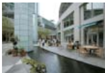
ライトタワープラザ Towers of Light Plaza

A state-of-the-art office building poised for the new century, with 43 stories above ground and 4 stories below. The restaurant on the 42nd floor commands superb night-time views.