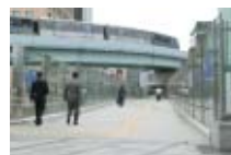
ペデストリアンデッキ Pedestrian deck

10番出口より徒歩1分 JR新橋駅汐留口より地下歩道にて徒歩6分 A One-minute walk from Exit #10. A Six-minute walk from the Shiodome Exit of JR Shimbashi Station, via underground walkway.