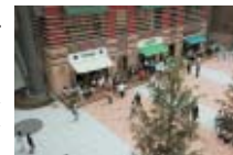
ゼロスタジオ広場 Zero Studio Plaza