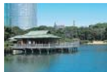
浜離宮 Hamarikyu Garden